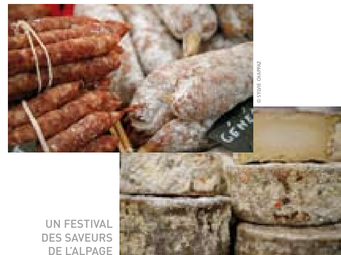
UN FESTIVAL DES SAVEURS DE L'ALPAGE

Elle est forte, elle est belle, l'image des produits de montagne et presque toujours à juste titre. Pourtant au dos de la carte postale, se cache une réalité qui montre que du producteur au consommateur, le chemin est semé d'embûches.