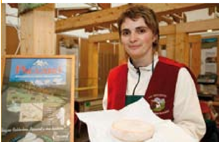
LE REBLOCHON, FERMIER, UNIQUEMENT FERMIER !